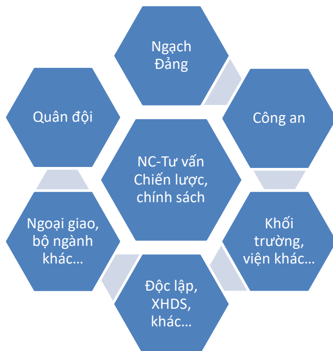
Hình minh họa 1. ‘Lục lăng’ nghiên cứu, tư vấn chính sách, chiến lược an ninh, đối ngoại và quốc phòng Việt Nam (Ngô Quốc Phương, Hội thảo Hà Budapest 2017).

linh hoạt, năng động trong ứng phó với các biến chuyển, thay đổi dựa trên nguyên lý “cân bằng động” được tham chiếu với chiến lược quan hệ quốc tế có tính tổng thể hơn mà theo đó Việt Nam tuyên bố muốn làm bạn với tất cả các quốc gia trên thế giới, trên cơ sở đường lối và chủ trương “đa dạng hóa, đa phương hóa” về đối ngoại và hợp tác của mình.